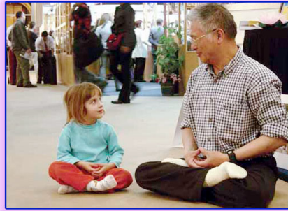
上图：善良无罪，修炼无罪。