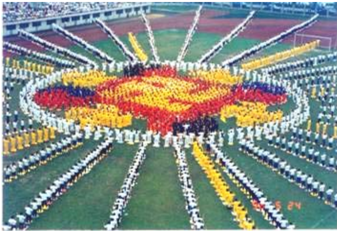
1996 年, 武汉, 五千名法轮功学员集体炼功, 组成辉煌的法轮图形

法轮大法自 1992 年 5 月公开向社会传出,到 1999 年 7 月,短短的七年时间里,在全世界吸引了上亿有志有识之士。大法修炼不求名、不求利,强调用“真善忍”的法理约束自己。无论男女老幼,无论来自哪个国家、民族,只要坚持修心炼功者无不深深受益。