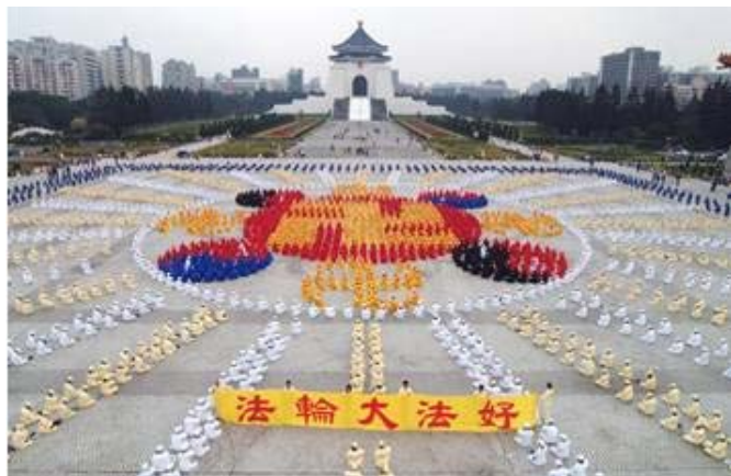
2005 年 12 月 25 日，4000 名台湾法轮功学员在台北排组法轮图形，展示法轮大法洪传世界的辉煌

这是自 1999 年 7 月 20 日中共政权迫害法轮功 6 年多来，法轮功学员首次排组壮观盛大的法轮图形。展现了法轮功学员面对迫害坚忍不屈的精神。