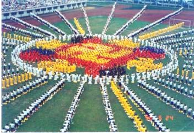
1996 年, 武汉, 五千名法轮功学员集体炼功, 组成辉煌的法轮图形

法轮大法自 1992 年 5 月公开向社会传出,到 1999 年 7 月,短短的七年时间里,在全世界吸引了上亿有志有识之士。大法修炼不求名、不求利,强调用“真善忍”的法理约束自己。无论男女老幼,无论来自哪个国家、民族,只要坚持修心炼功者无不深深受益。