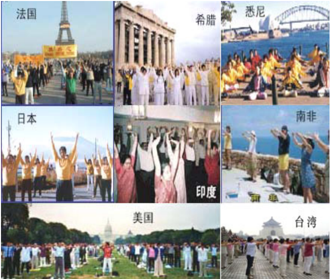
法轮大法自 1992 年 5 月公开向社会传出，到

尘之中多么渴望能常见到你们的身影，那‘真、善、忍’的光芒照射着我这个凡夫俗子的心，使我平静，使我澄澈，更使我升华。愿中华儿女的后代子孙们永享‘真、善、忍’带给他们的美好，感谢你们将神赐予人类的最完美的精神帮人类保存了下来，我想未来的人类一定会明白你们今天的良苦用心，也一定会珍惜神的恩赐。”◇