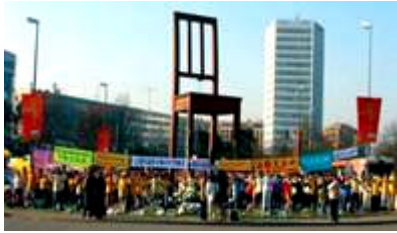
来自全球的法轮功学员在联合国前炼功、讲真相

文章说，中共企图阻止在人权理事会上讨论“关于中共摘取法轮功修炼者人体器官的问题”，但是没有成功。这次在日内瓦举行的会议于十月六日结束。一些联合国的报告员将参与对此事的调查，并向联合国作出报告。