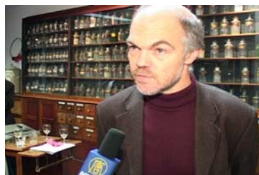
万可润可斯文参议员就制止 中共器官贩卖接受记者采访

官有可能是从死刑犯身上摘取所得，并高额出售。但这并不能解释所有的器官来源。万可润可斯文先生说：“如果你把在中国的器官移植数量和官方报道的死刑数量作比较，你就会发现还有大约六千例的差距。”