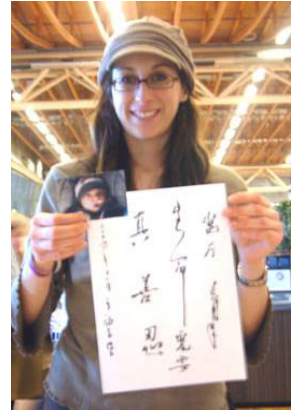
▲ 一位妈妈高兴地举着孩子照片和“真善忍”字幅

有几位推儿童车的妈妈，拿到条幅后，高兴地说，要回家镶在镜框里，挂在墙上，希望孩子能按“真善忍”的做人准则来成长。◇