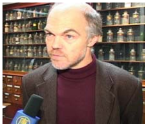
万可润可斯文参议员 就制止中共器官贩卖 接受记者采访