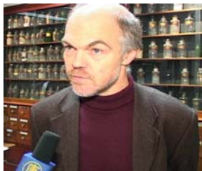
万可润可斯文参议员 就制止中共器官贩卖 接受记者采访

江齐齐哈尔市碾子山大法弟子，今年 51 岁，98 年 10 月得法修炼。99 年迫害以来，她坚修大法，还积极主动做着证实法的事，曾去北京上访。从 2000 年开始到现在，共被绑架五次，遭受邪恶残酷迫害，四次被绑架到碾子山非法折磨，前四次她都正念闯出魔窟。但在最近第五次绑架中，邪恶对她施行了毫无人性惨绝人寰的毒打，奄奄一息的她全身浮肿，腿部淌水，最后终因脏器伤害严重而被迫害致死。