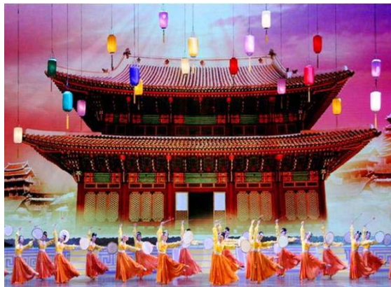
2006年新唐人全球华人新年晚会剧照