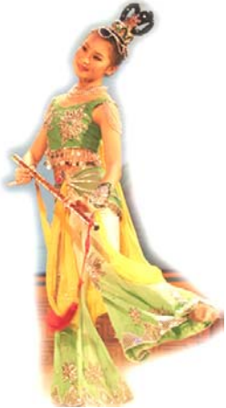
《仙笛》中夏雪儿的剧照

家，要钱有钱，要势有势，呼风唤雨，但贪心不足，奇妒无比。她不信阴司报应，为了三千两银子将一对年轻恋人逼死。她又大闹宁国府，设计逼死柔弱温顺的尤二姐，平时又大放高利贷，贪婪与嫉妒，将她与生俱来的福气尽折，所以，年纪轻轻就“机关算尽太聪明，反误了卿卿性命。”