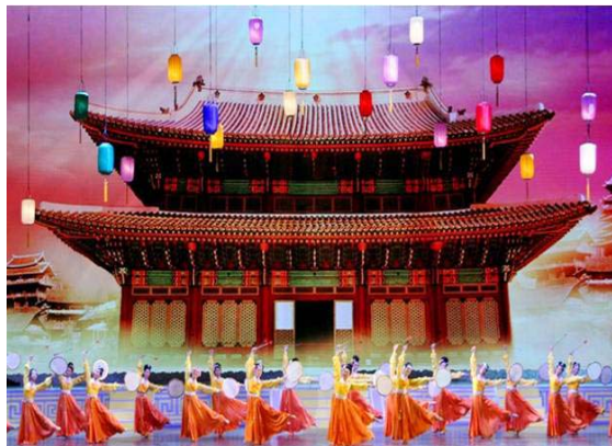
2006年新唐人全球华人新年晚会剧照