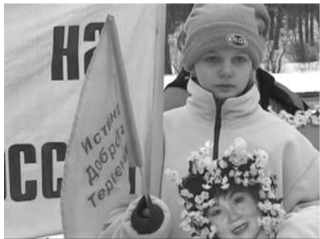
俄罗斯法轮功学员中领馆前抗议迫害

嘿，这个“阿米尔梯队”可不简单，他们整齐、迅速、灵活。在莫斯科讲真相有他们，在圣彼得堡讲真相有他们，在俄罗斯法会上有他们，在中使馆前抗议迫害有他们，在法轮功