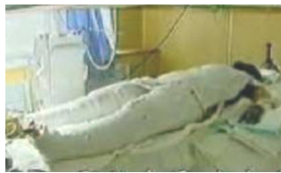
《焦点访谈》中的“自焚者” 被包裹得严密。