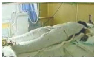
《焦点访谈》中的“自焚者” 被包裹得严密。