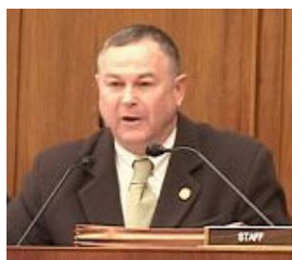
国会议员德纳·罗拉巴克

【明慧网 2006 年 4 月 24 日】81 名美国国会议员联名致信美国总统布什，表示对最近曝光的中共未经本人同意活体摘取法轮功学员器官的指控，严正关注。信件已经送交白宫。这 81 名国会议员呼吁布什，“我们的国家在这个问题上表明立场并调查这些指控至关重要，因为我们应