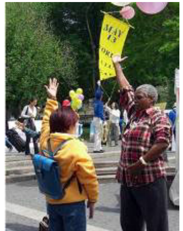
美国纽约民众在学功 (2006 年 5 月 13 日)

为你祝福， 为你而来， 我把真心向你敞开， 我把真相向你呈献—— 大法可贵， 万世机缘。