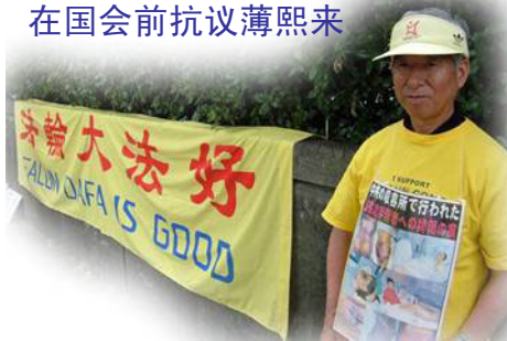
图：近 70 岁的伊贺老人在国会前抗议薄熙来

据统计，薄在担任辽宁省长期间，至少有 103 名法轮功学员被迫害致死。有多名证人揭露位于沈阳苏家屯的集中营自 2001 年起活体摘取法轮功学员的器官。◇