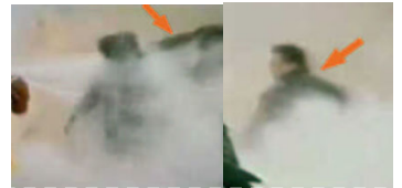
1, 刘头部受重击。 2, 打击者仍保持用力姿势

所以这个什么自焚在我们那个居住区都知道是假的，春玲是被人骗了，被人害了，真可怜。”