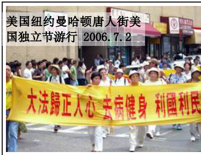
美国纽约曼哈顿唐人街美国独立节游行 2006. 7. 2