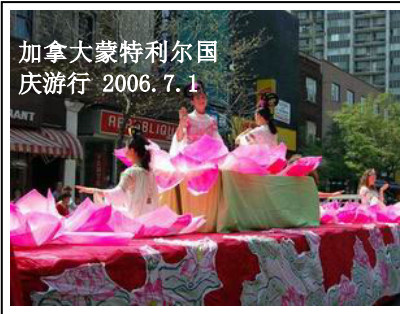
加拿大蒙特利尔国庆节游行 2006. 7. 1