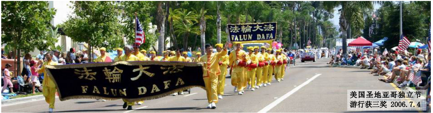
美国圣地亚哥独立节游行获三奖 2006. 7. 4