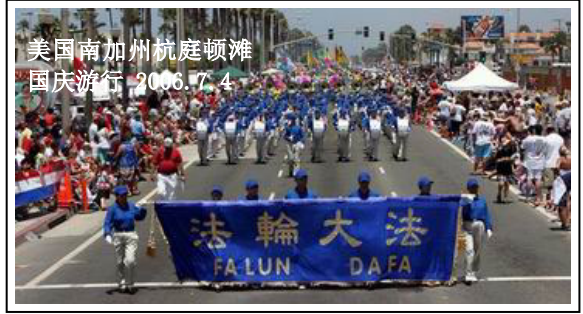
美国南加州杭庭顿滩国庆节游行 2006. 7. 4