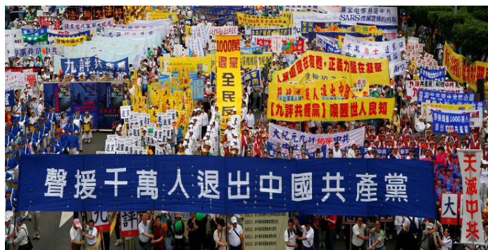
台湾各界声援大陆一千万民众退党