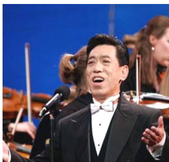
在全球华人新年晚会上演出 (纽约无线电音乐城, 2006 年)