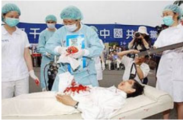
模拟中共活摘法轮功学员器官

加通社的报导引述调查报告说：“这一恐怖的调查结果让我们震惊的无法相信，但这并不意味着这些指控不是真实的。”