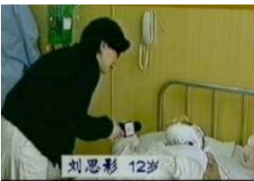
气管切开还能说、唱？记者采访不穿防护服，不戴口罩