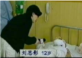
气管切开还能说、唱？记者采访不穿防护服，不戴口罩