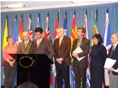
加拿大保守党联席会主席雷汉姆-杰福 雷汉姆-杰福（中）

2006年7月6日加拿大的乔高和麦塔斯发表“关于调查指控中共摘取法轮功学员器官的报告”，认为活体摘取法轮功学员器官的行为是“前所未有的邪恶形式”的结论。7月13日，加拿大保守党联席会主席雷汉姆-杰福