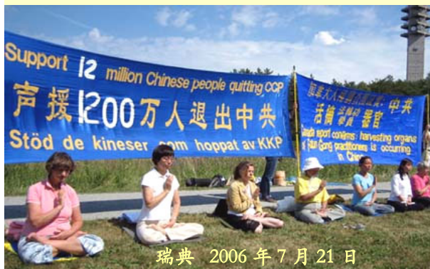
瑞典 2006 年 7 月 21 日

中华五千载 神州大舞台 代代有忠奸 辈辈出英才 不分年长幼 人心见好坏 好人天护佑 行恶遭淘汰 中共假恶暴 祸国五十载 杀人八千万 报应招天灾 天意灭中共 劝君当自爱 退党保平安 分秒莫懈怠 有缘听呼唤 生命得未来