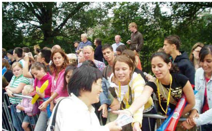
第 30 届国际 △人们纷纷索要精美的洪法书签