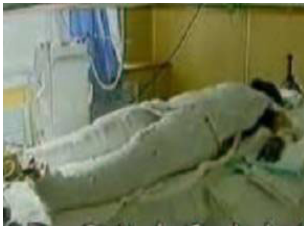
气管切开还能说、唱？记者采访不穿防护服，不戴口罩 央视《焦点访谈》中的“自焚者”被包裹得严密。

不能用药布包裹烧伤部位，但电视上的“自焚”者却全身包裹严密，丝毫不符合基本的医学常识。