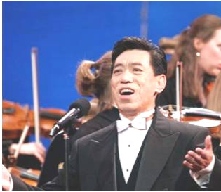
在全球华人新年晚会上演出 (纽约无线电音乐城，2006)

新唐人华人新年晚会波士顿首场演出期间，有机会采访了著名男高音歌唱家关贵敏先生。话未几句，关贵敏便痛感于如今的中国社会道德风气下滑之快，演艺界亦不例外。在那样的大染缸中，不受污染很难，甚至变得不好了都意识不到。关贵敏说，在国内时，是觉得活得郁闷别扭，但并没有感觉太大的不对劲。出来一看，才知道生活在国内即便有锦衣玉食，也是非常的悲哀，因为人们的思想完全被禁锢着。关贵敏经常与朋友说“人的思想就如同水，放在什么容器里，就成什么形状。中共让你习惯于它灌输的党文化，到一定时候再改变非常之难，甚至让你心甘情愿地为它唱赞歌。”