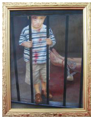
▲《为什么》，油画 汪卫星，2004

善良的人们，有谁能救救月童一家？月童想回家，想和爸爸妈妈一起回家，她已经到了上学的年龄了，她该上学了……◇