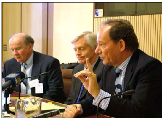
► 欧议会副主席爱德华（右）在澳洲的新闻发布会上发言

加拿大前国会议员大卫·乔高和欧洲议会副主席爱德华·斯考特，8月中旬应邀专程访问澳洲，向澳洲政界及公众报告关于“中共活体摘取法轮功学员器官”的调查，并与澳洲政要共商揭露被中共刻意隐瞒的活摘器官惨案，以结束对法轮功修炼者的迫害。