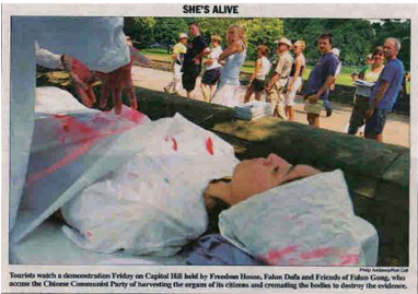
▲7月24日，美国国会山《点名(Roll Call)》报刊登模拟中共活摘法轮功学员器官展图片

7月下旬，他们三人在美国波士顿出席首届世界器官移植大会时，法轮功学员向美国麻州检察处正式递交刑事告诉状，控告他们触犯酷刑罪。原因是他们所在的移植中心涉嫌参与活体摘取法轮功学员器官。三家医院的医生在电话录音中均承认，为病人移植的活体器官来源有活着的法轮功学员。“国际追查组织”有录音为证。