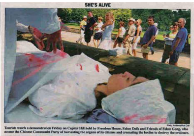
▲7月24日，美国国会山《点名(Roll Call)》报刊登模拟中共活摘法轮功学员器官展图片

7月下旬，他们三人在美国波士顿出席首届世界器官移植大会时，法轮功学员向美国麻州检察处正式递交刑事告诉状，控告他们触犯酷刑罪。原因是他们所在的移植中心涉嫌参与活体摘取法轮功学员器官。三家医院的医生在电话录音中均承认，为病人移植的活体器官来源有活着的法轮功学员。“国际追查组织”有录音为证。