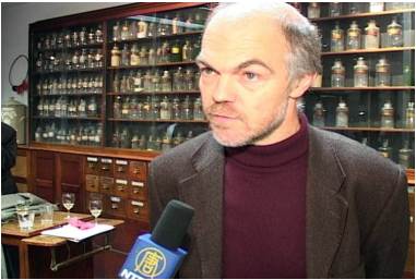
万可润可斯文参议员就制止中共器官贩卖接受记者采访

【明慧网】自十一月二十七日比利时各大媒体报导参议员万可润可斯文调查中共器官贩卖一事