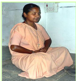
▲这位印度天主教学校的修女教师说：“佛祖来到了世间。”

据不完全统计，到目前为止，印度有超过三十五所学校，大约一万八千名学生、老师和家长开始修炼大法，而且，每一所学校都主动的把大法介绍给下一所学校，负责教功