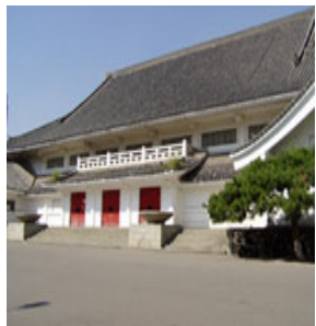
李老师曾传功的 吉大鸣放宫

一九九三年六月末，一个“偶然”的机会，我得知师尊在吉林省委礼堂办传功讲法班，我当时就想进去听一听。跟工作人员一说，工作人员竟然在我没钱的情况下也让我进去了。