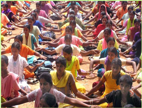
这所印度公立女子学校校长组织全体一千两百名学生炼法轮功。

中共迫害法轮功的七年多来，法轮大法在海外每洪传一处，都有千千万万善良人从佛法中受益，“这么好的功法，中共为何要迫害？”——这也成了全世界善良人共同的疑问。