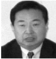
主管迫害法轮功的恶人:都本有

各地迫害法轮功的真正幕后操纵者都是政法系统的负责人，对法轮功学员的非法绑架、监控、诉讼、量刑、关押等迫害都是在它的指使下进行的。