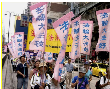
▲香港“法轮大法好”彩旗飘扬

有的人不走了，坐下看起来。导游一看说“不行，大家快走，地方还多着呢！”有个中国的导游对大家说：“这些发资料