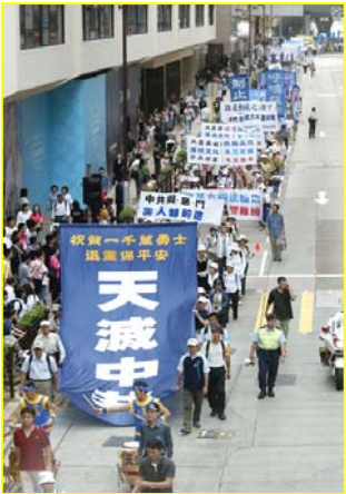
▲“天灭中共”大幡在香港九龙闹市区

好个“阴阳界”，这大陆和香港到底哪面是阴哪面是阳呢？中共又为什么如此惧怕这小小的传单和光盘呢？在这个世界上，只有谎言才会惧怕真理。真希望早日破除这个“阴阳界”，让咱们更多大陆同胞都能看到另一面的世界！