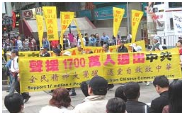
香港游行声援一千七百万中国民众退出中共恶党、团、队

《九评共产党》一书深刻揭露了中共邪恶本质，已在中国促成强大的退出中共恶党的大潮，到2007年1月16日已有超过 1744万 中国民众在海外大纪元网站声明退出中共党、团、队。其中包括中共党政军高层内的党员。