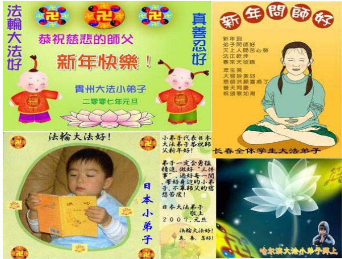
世界各地的法轮功小学员为师父献上的贺卡