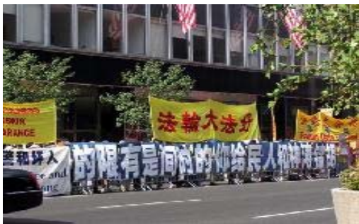
海外法轮功学员对胡锦涛展开的劝善横幅：胡锦涛神和人民给你的时间是有限的

老国王刚刚经历抽筋之苦，等着他的是更可怕的扒皮。所以便迫不及待地说：“愿意，我愿随您下界、助您正法，除掉恶龙。”大神仙将老国王托在掌心，飘然而去。在“枯金湖”的上空，大神仙再一次威严的对老国王叮嘱道：“记住这个地方，记住地狱之苦，记住你的誓约。”