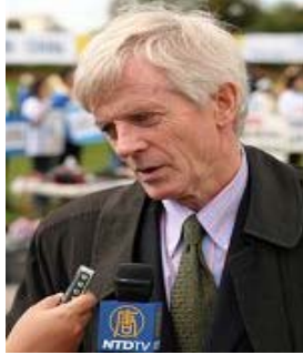
加拿大调查员乔高

乔高认为，如果中国政府不马上停止迫害，他们将在奥运会前面临巨大压力。乔高说，“中国政府知道，他们不得不停止为了（主要向外国人）贩卖人体器官而杀人。因为世界上越来越多的人知道了发生着什么，他们将出来制止……。”