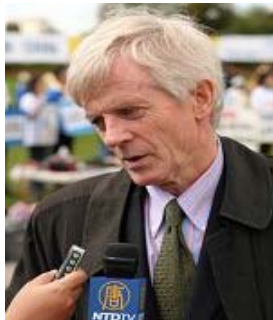
加拿大调查员乔高

乔高认为，如果中国政府不马上停止迫害，他们将在奥运会前面临巨大压力。乔高说，“中国政府知道，他们不得不停止为了（主要向外国人）贩卖人体器官而杀人。因为世界上越来越多的人知道了发生着什么，他们将出来制止……。”