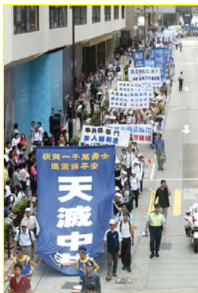
▲“天灭中共”大幡 在香港九龙闹市区