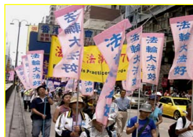
▲香港“法轮大法好”彩旗飘扬

有的人不走，坐下看起来。导游一看说“不行，大家快走，地方还多着呢！”有个中国的导游对大家说：“这些发资料的人都是领了美国人的工资才干这个。”