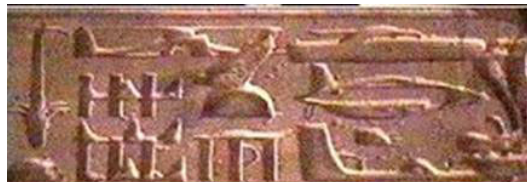
▲埃及 Abydos 古庙浮雕中的飞机模型

对于史前文明，在法轮功的主要著作《转法轮》中给出了更详细的解释，并指出：“其实不只是气功是久远年代留下来的，太极、河图、洛书、周易、八卦等等，都是史前遗留下来的。所以我们今天站在常人的角度去研究它，去认识它，怎么也研究不明白的。站在常人这个层次、这个角度、这个思想境界中，理解不了真正的东西。”◇