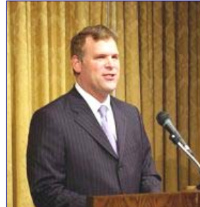
加拿大环境部长国会议员约翰·贝尔到晚会祝贺

一月十二日晚，加拿大环境部长、国会议员约翰·贝尔代表总理和加拿大政府到晚会现场致贺。他表示：“新唐人电视台、大纪元时报等华人社团把这台晚会带到渥太华，对此我感到非常高兴和荣幸。”