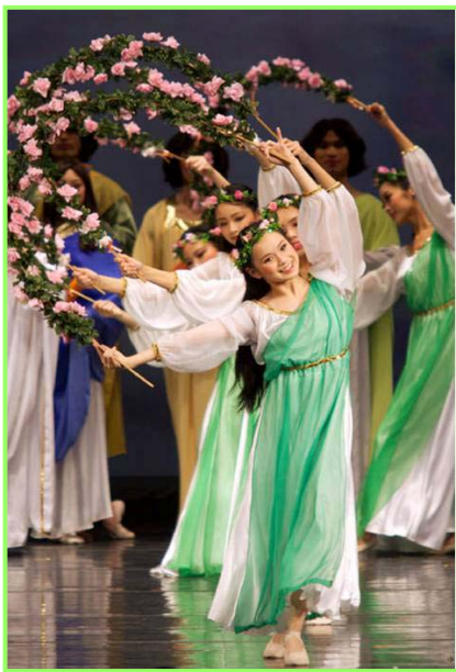
▲舞蹈《誓约》。慈悲的神立誓下世救人，并为人类有得救的机会而欢庆。

一位七十多岁的老华侨为看晚会不惜辗转到达旧金山。他说，每个节目都太美、太正了；他边看边流泪。老人知道很多法轮功学员参与了晚会演出和创作，他感慨的说：“他们所做都是无私付出，不是为了名利和钱，而是真正的为了中国人。”◇