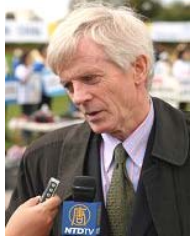
加拿大调查员 大卫·乔高

乔高认为，如果中国政府不马上停止迫害，他们将在奥运会前面临巨大压力。乔高说，“中国政府知道，他们不得不停止为了（主要向外国人）贩卖人体器官而