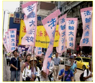
▲香港“法轮大法好”彩旗飘扬

【明慧网】我是一家医院的负责人，十月份本院一行十几人去香港旅游几日。来到香港真是大开眼界，这里完全是另外一个世界。法轮功在这里是公开合法的。每到一处都有法轮功修炼人给我们讲真相发传单、送光盘等。特别是海洋公园太热闹了，其中有一段路程约七、八十米两边全是法轮功的标语、画展，“一千六百万人退出党、团、队”的大横幅到处可见，高音喇叭里在播放奇书《九评共产党》……由于我们都是第一次来，真有点吃惊。有的职工问我：“院长，可以接资料吗？”我说：“别人都接，我们就接吧。”又问：“可以看吗？”我说：“既能接、就能看。”