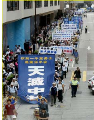
▲“天灭中共”大幡在香港九龙闹市区

在这个世界上，只有谎言才会惧怕真理。真希望早日破除这个“阴阳界”，让咱们更多大陆同胞都能看到另一面的世界！◇