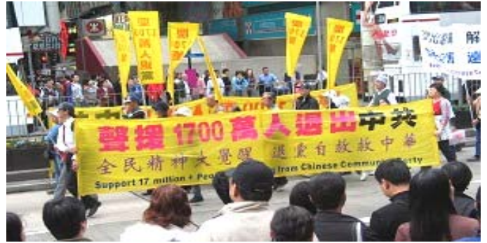
香港游行声援一千七百万中国民众退出中共党、团、队

《九评共产党》一书深刻揭露了中共邪恶本质，已在中国促成强大的退出中共恶党的大潮，到 2007 年 1 月 29 日已有超过 1794 万中国民众在海外大纪元网站声明退出中共党、团、队。其中包括中共党政军党政军高层内的党员。