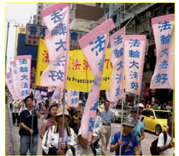
▲香港“法轮大法好”彩旗飘扬

【明慧网】我是一家医院的负责人，十月份本院一行十几人去香港旅游几日。来到香港真是大开眼界，这里完全是另外一个世界。法轮功在这里是公开合法的。每到一处都有法轮功修炼人给我们讲真相发传单、送光盘等。特别是海洋公园太热闹了，其中有一段路程约七、八十米两边全是法轮功的标语、画展，“一千六百万人退出党、团、队”的大横幅到处可见，高音喇叭里在播放奇书《九评共产党》……由于我们都是第一次来，真有点吃惊。有的职工问我：“院长，可以接资料吗？”我说：“别人都接，我们就接吧。”又问：“可以看吗？”我说：“既能接、就能看。”