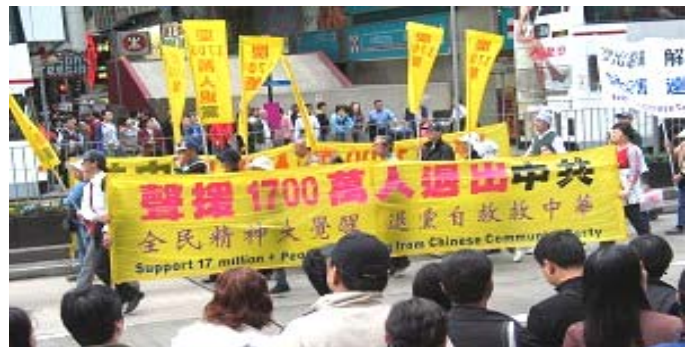
香港游行声援一千七百万中国民众退出中共党、团、队

《九评共产党》一书深刻揭露了中共邪恶本质，已在中国促成强大的退出中共恶党的大潮，到 2007 年 1 月 29 日已有超过 1794 万中国民众在海外大纪元网站声明退出中共党、团、队。其中包括中共党政军党政军高层内的党员。