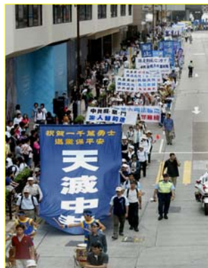
▲“天灭中共”大幡在香港九龙闹市区

在这个世界上，只有谎言才会惧怕真理。真希望早日破除这个“阴阳界”，让咱们更多大陆同胞都能看到另一面的世界！◇