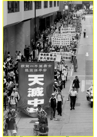
▲“天灭中共”大幡在香港九龙闹市区