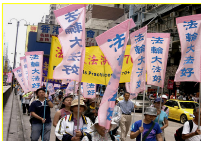
▲香港“法轮大法好”彩旗飘扬