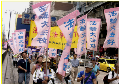
▲香港“法轮大法好”彩旗飘扬