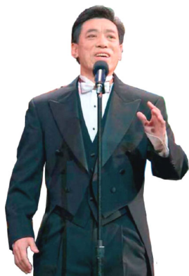
关贵敏在零六年全球华人新年晚会上演出

关贵敏，于一九七八年考入中央电影乐团成为专业歌手。他音域宽广、音色明亮纯厚，在歌唱界独树一帜，是国家一级演员、著名男高音歌唱家。