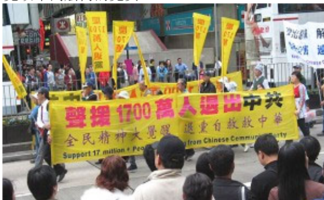
香港游行声援一千七百万中国民众退出中共恶党、团、队

《九评共产党》一书深刻揭露了中共邪恶本质，已在中国促成强大的退出中共恶党的大潮，到 2007 年 1 月 9 日已有超过 1722 万 中国民众在海外大纪元网站声明退出中共党、团、队。其中包括中共党政军高层内的党员。