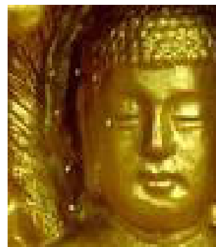
佛像上出现佛家传说 中的优昙婆罗花

近期，中国大陆各地陆续出现“优昙婆罗花”的盛开，从寺院到寻常百姓家，令人备感佛恩。信神佛者更坚定信念，无神论者也该默然思量。人世间每件大事的发生，都对应着天象，是天象变化的反映。“种瓜得瓜，种豆得豆”，因果报应不论人是否相信，也不管其身份贵贱，都一视同仁，毫厘不差。