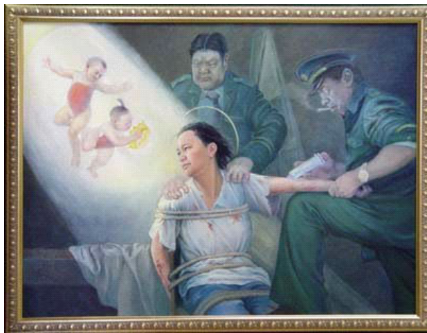
大法弟子美术作品： 《光明与黑暗》