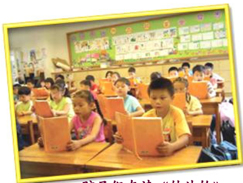
孩子们在读《转法轮》

日常生活中，我用善恶有报、行善积德的故事引导他们，教导他们读法轮功的著作《转法轮》和《洪吟》，讲述其中的法理：做好事会得到白色物质“德”，而做坏事会得黑色物质“业力”，所以做人要说真话、不自私、与人为善、宽容忍让的道理。