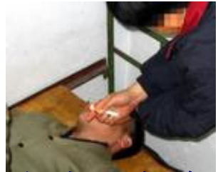
酷刑演示：烟熏眼睛

在对我四个多小时的老虎凳折磨后，又用铁桶套在奄奄一息的我的头上，七个警察每人抽三支烟，往桶里喷了一个多小时，我一阵阵被呛得昏迷，又一次次用凉水浇我，我没有完全清醒他们又用抽的三枝烟，猛抽一口，用烟头扒开我的眼烤，烤痛