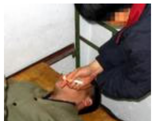
酷刑演示：烟熏眼睛

在对我四个多小时的老虎凳折磨后，又用铁桶套在奄奄一息的我的头上，七个警察每人抽三支烟，往桶里喷了一个多小时，我一阵阵被呛得昏迷，又一次次用凉水浇我，我没有完全清醒他们又用抽的三枝烟，猛抽一口，用烟头扒开我的眼烤，烤痛