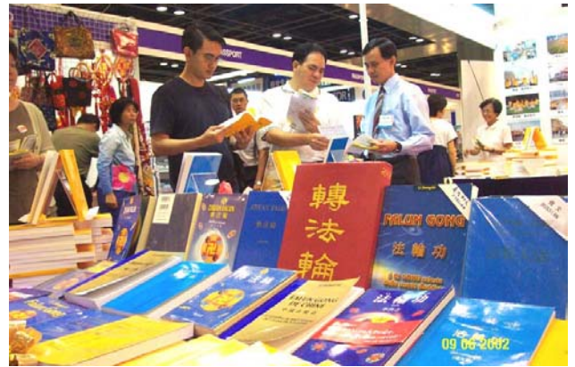
新加坡世界书展中的各语种法轮功书籍。 (2002 年 6 月)

自 1992 年传出后，修炼人数呈几何增长，至 1999 年 7 月镇压前，有上亿人修炼。在 XX 党持续八年灭绝性的迫害下，法轮功不但没有倒下，反而迅速洪传至 80 多个国家和地区。仅台湾一地，修炼人数就由 XX 党迫害之初的数千人，增加至现在的超过 30 万人。