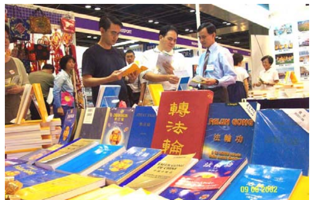
新加坡世界书展中的各语种法轮功书籍。 (2002 年 6 月)

自 1992 年传出后，修炼人数呈几何增长，至 1999 年 7 月镇压前，有上亿人修炼。在 XX 党持续八年灭绝性的迫害下，法轮功不但没有倒下，反而迅速洪传至 80 多个国家和地区。仅台湾一地，修炼人数就由 XX 党迫害之初的数千人，增加至现在的超过 30 万人。