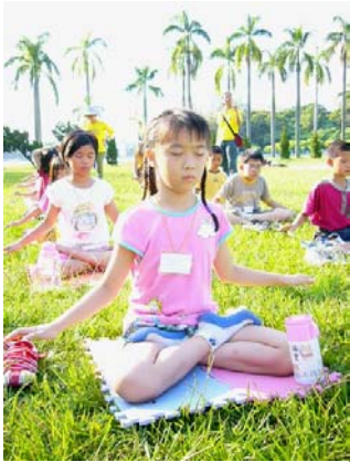
2004 年南台湾明慧学校夏令营活动

30 种语言出版发行；目前世界 80 多个国家和地区有法轮功修炼者；法轮大法使各国人民对中国的悠久灿烂文化更加向往，给中国赢得巨大的国际声誉，截止 2007 年 10 月，获得海外各国政府及各界的 2890 多项褒奖与支持议案信函（包括美国、加拿大、澳大利亚、台湾、欧洲、新西兰、日本、印度尼西亚、秘鲁和中国 1999 年以前颁发的 6 项）。李洪志先生从 2000 年起连续四度获诺贝尔和平奖提名。这显示了真善忍佛法的超越民族、国界和时空的巨大威德和感召力。