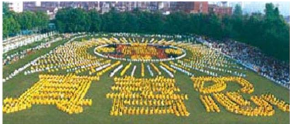
湖北省武汉市，5000 多法轮功学员集体炼功， 组成“法轮图形”和“真善忍” ---1997