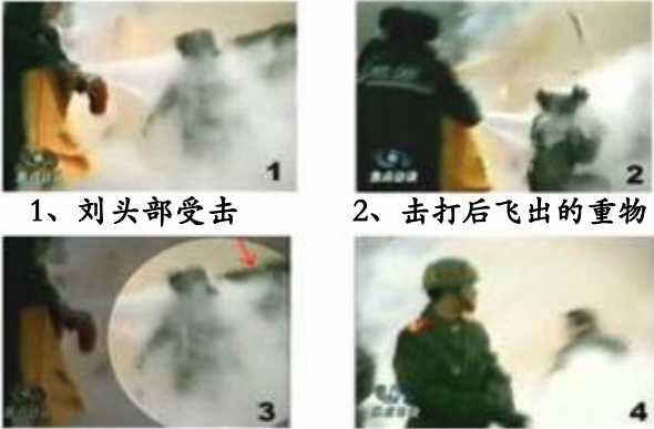
1、刘头部受击 2、击打后飞出的重物 3、重物飞越人头顶 4、击打者仍保持用力姿

部，穿着军衣的武警正走向镜头前面，在他身后，一名身穿大衣的男子正好站在出手打击的方位，仍然保持着一秒钟前用力的姿势。