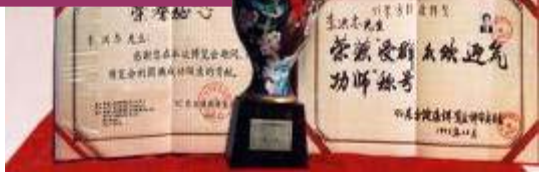
世界各国褒奖及法轮功创始人在九三年东方 健康博览会上的获奖证书