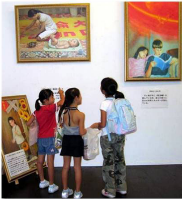
日本小学生看法轮功学员作品

六日，日本第十一届“真善忍美展”在仙台举行，前来参观的民众络绎不绝，许多人在了解了法轮功在中国大陆遭受残酷迫害的真相后感到震惊，一位老奶奶看到真实再现法轮功学员遭受酷刑的画作时赞叹：只有真