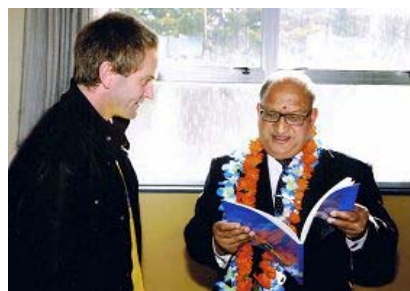
新西兰总督 Anand Saty 一边听法轮功学员讲真相，一边翻阅《真善忍国际美术展作品集》

【明慧网二零零七年十月六日】近日，法轮功学员在新西兰的若托鲁阿（Rotorua）举行“大法弟子证实法摄影展”。在展览过程中，办展的法轮功学员见到