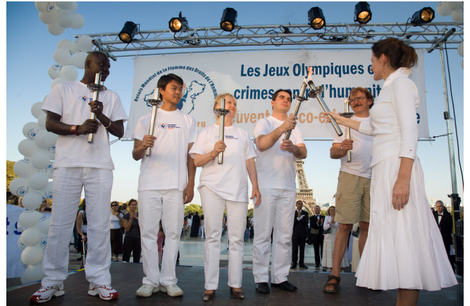
▲巴黎人权广场点燃象征五大洲的五把人权火炬

人权圣火全球传递活动于当地时间9月16日下午4点半，传递到了“人权祖国”法国首都巴黎（“世界人权宣言”在此签订而得名）。法国各界政要、运动员、演艺界、华人社团近千人聚集在 인권广场，为人权圣火的到来欢呼鼓掌。现场举行了演讲、音乐会、烛光守夜活动。法国多位政界要员发来贺信表示高度的支持。