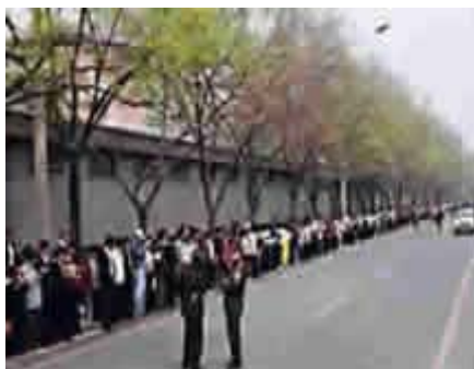
“4.25”事件现场，法轮功学员秩序井然。

4月25日，朱镕基总理及高层官员与法轮功学员代表进行了会谈。代表们表达希望政府释放天津学员，给予法轮功学员一个宽松的修炼环境以及合法出版法轮大法书籍的权利。傍晚时分，天津按照中央指示释放了所有被关押的法轮功学员。法轮功学员自始至终秩序井然。当问题得到基本解决后，学员们有秩序地迅速离开，在离开之前，纷纷将地上的垃圾和纸屑捡起，连警察扔的烟头都被捡起扔入垃圾桶。