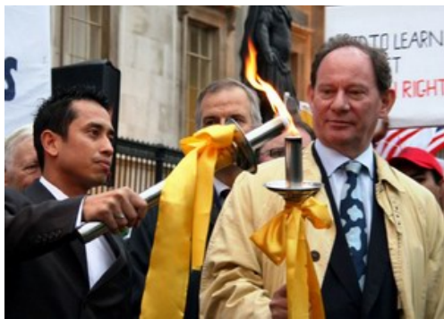
欧洲议会副主席麦克米兰·史考特与前奥运会游泳运动员伽弗瑞·杜拉潘丹正点燃火炬

【明慧网】二零零七年十月二十五日，人权圣火全球传递活动抵达英国伦敦。人权圣火传递活动是由全球三百多名政要、医生、律师等组成的“法轮功受迫害真相联合调查团”发起，在全球巡回传递，目的是呼吁国际社会关注中国恶劣的人权状况、尤其是中共对法轮功的迫害，拒绝让象征人类和平自由的奥运变成中共实行独裁和镇压的“血腥奥运”。英国伦敦是人权圣火传抵的第十八个国家，第二十五个城市。