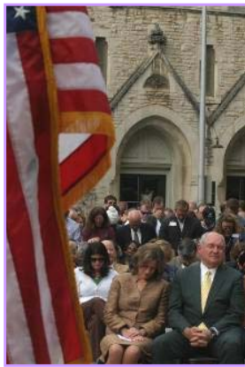
普度夫妇（前排） 在祈雨仪式上

2. 李湛军的言论凸显了中共对法轮功群体的迫害政策仍在持续，而且公然把对法轮功群体的歧视与迫害延伸到被人类视为具有崇高追求的奥运会，这种对人权的侵犯公开化和国际化恶劣行径，不仅是对奥林匹克精神的粗暴践踏，也是对国际社会道德底线的严峻挑战。对于口口声声反对把奥运政治化的中共，这更是中共自己把奥运政治化的最佳例证。