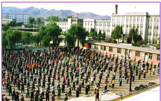
历史图片：九八年凌源法轮功学员市府广场晨炼

在丰润区一个小村庄。有一村民看见地上有一张报纸，以为是法轮功真相资料，就捡起来对旁人说：咱王村长说了，举报一个讲真相的法轮功学员给五百元钱。旁边一位妇女斥责道：炼法轮功的都是好人，他就是给一万元也不去举报，谁办那个缺德事！