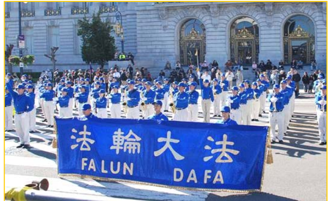
天国乐团在游行主席台前演奏

能够参加今天的游行，法轮功天国乐团的演奏尤其震撼。谈到在中国发生的对法轮功学员的迫害，他表示美国人有自己的信仰自由。（在中国）不允许人有信仰自由，并把他们关进监狱，这是错的。◇