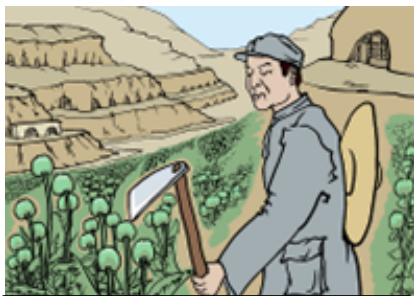
南泥湾“大生产运动”，实际上是非法种鸦片的运动。

当时我的家乡属于沦陷区，中共叫“敌后”，八路军的一支部队在那驻扎七年，后来我成了其中的一员。在我入伍前后整整七年间，该部队没打过一次日本人。当时日本人就在城内，八路军在城外。后来，国民党部队一个旅开到当地，准备向日军开战。在国军立足未稳、毫无防备的情况下，突然被我所在的部队团团包围聚歼。激烈的战斗进行了一天一夜，国军的这支抗日部队整整一个旅全被消灭。