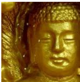
佛像上出现佛家传说中的 优昙婆罗花

在佛教经典中，记载了有关“优昙婆罗花”的故事。根据佛经记载，“优昙婆罗花为祥瑞灵异之所感，乃天花，为世间所无，若如来下生、金轮王出现世间，以大福德力故，感得此花出现。”。优昙婆罗花每三千年开花一次，这种花的出现意味着转轮圣王已下世在人间正法，“金轮王出现世间”即解为此。