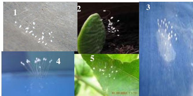
世界各地各处盛开的优昙婆罗花：

只要我们注意到优昙婆罗花当世开放的事实，那么我们会惊讶地发现，只差撩开薄薄的一层面纱，世人生生世世期盼着的那个归来者已经呼之欲出。