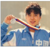
前奥运游泳选手 黄晓敬