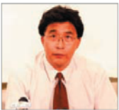
前沈阳市司法局 局长 韩广生