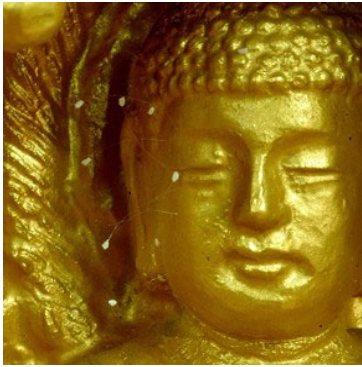
二零零五年初，韩国全罗南道顺天市海龙面的须弥山禅院，佛像面部开了十朵优昙婆罗花。

优昙婆罗花于一九九七年在韩国全罗南道顺天市须弥山禅院的佛像上首次被发现（下图），之后，中国大陆、香港、台湾、美国北加州、纽约、德克萨斯州的休士顿、奥斯汀等城市又有发现。那么，优昙婆罗花的绽放意味着什么？