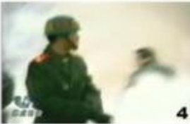
4、击打者仍保持用力姿