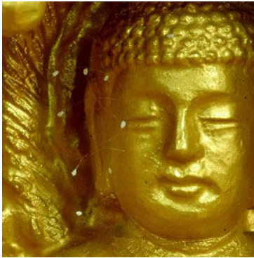
二零零五年初，韩国全罗南道顺天市海龙面的须弥山禅院，佛像面部开了十朵优昙婆罗花。

优昙婆罗花于一九九七年在韩国全罗南道顺天市须弥山禅院的佛像上首次被发现（下图），之后，中国大陆、香港、台湾、美国北加州、纽约、德克萨斯州的休士顿、奥斯汀等城市又有发现。那么，优昙婆罗花的绽放意味着什么？