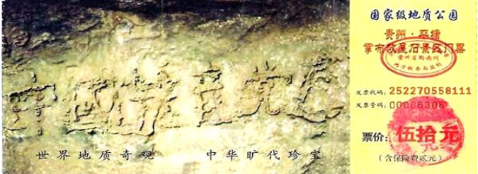
贵州省平塘县掌布乡风景区门票

经专家鉴定该巨石是二亿七千万年前生成、五百年前从山上滚下裂开的，非人力所作。从中共宣布镇压法轮功开始，就注定了中共走向灭亡，“藏字石”是神对中共的判决令。