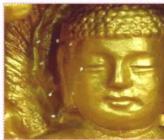
2005 年韩国全罗南道顺天寺的佛像上出现了优昙婆罗花。