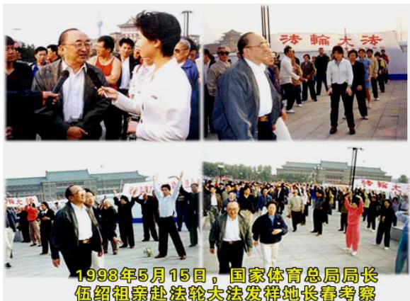
1998年5月15日，国家体育总局局长伍绍祖亲赴法轮大法发祥地长春考察

人类两次世界大战死亡的人数的总和。接二连三的各种血腥政治运动，镇反、三反、五反、肃反、反右、荒诞的大跃进和相继而来的三年大饥荒、反右倾、四清、文革、“六四”镇压学生、迫害法轮功，等等等等，无数善良人成了中共的虐杀对象。中共杀人太多，罪行滔天，天理不容！