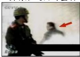
4、击打者仍保持用力姿势