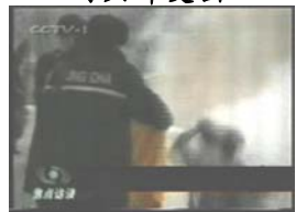
3、手摸被打后的头部