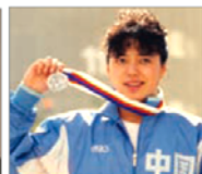
前奥运游泳选手 黄晓敏