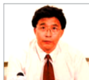
前沈阳市司法局 局长 韩广生