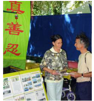
瑞士法轮功真相点

大陆游客们开始平静下来了。这时，大陆旅游团的导游大声说：“请大家都过来，我们到欧洲旅游要注意，要入乡随俗。欧洲有法律规定，发言是自由的，发材料也是自由的。你们可以听，也可以拿材料，你们看了材料，可以印在脑子里，记在心上，材料不带回去，不就行了。不要对人家（指发材料的法轮功学员）那样不好的态度。告诉你们，下一站是法国，也有法轮功学员发材料，你们可要注意了，注意中国人的形像。”◇