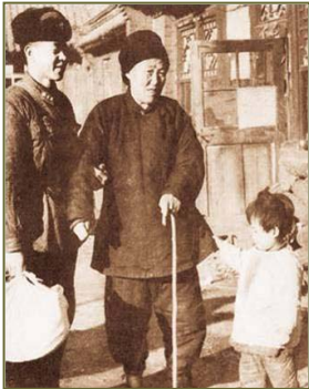
图：扶老携幼，还有随身摄影师抓拍精彩瞬间，真是“好人”有“好事”啊。

说起做好事不留名，人们几乎都能想起雷锋这个名字。然而在广为流传的雷锋故事里却被发现有很多疑问。