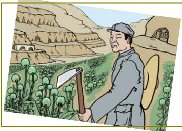
南泥湾“大生产运动”，实际上是非法种鸦片的运动。