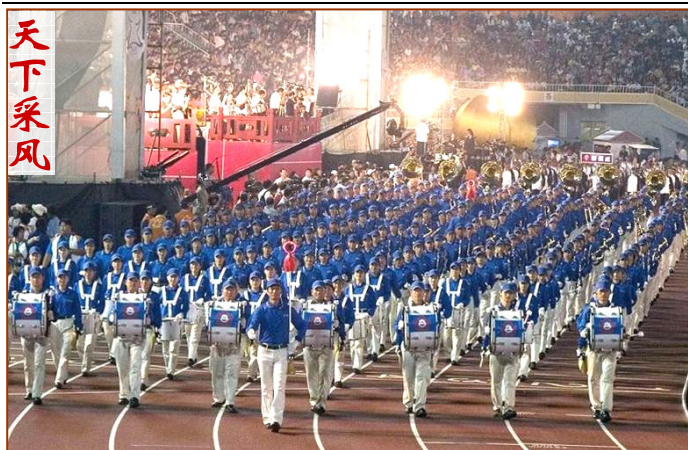
▲十月二十日晚，台湾全运会开幕典礼上，法轮功学员的天国乐团引领各县市选手进场，赢得热烈喝彩。