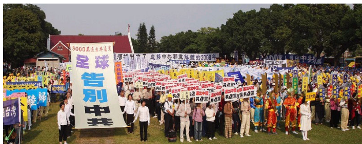
元网站声明退出中共党、团、队。其中包括中共

《九评共产党》一书深刻揭露了中共邪恶本质，已在中国促成强大的退出中共恶党的大潮，到2007年12月已有近3000万中国民众在海外大纪